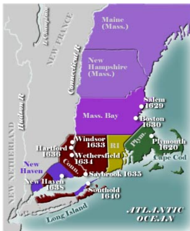
3 pav. Politinis 1600 – 1640 metų kolonijų žemėlapis 20

Indėnų išpuoliai nebuvo vienintelis motyvas susijungti į konfederaciją. Kaip matyti iš 3 paveikslo, buvo reali karo grėsmė iš olandų iš Naujųjų Nyderlandų bei prancūzų iš Kanados. Buvo tikimasi, kad Konfederacijos pagrindu pavyks spręsti ir kitas aktualias problemas, tarp kurių minėtinas kolonijų sienų klausimas.