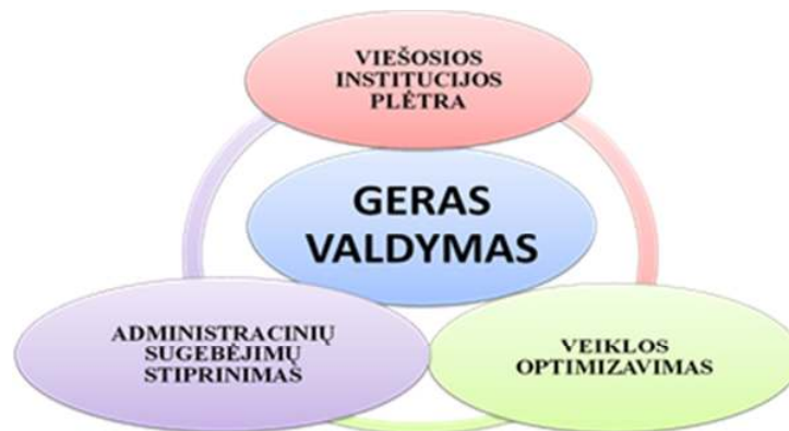
2 pav. Gero valdymo veiksniai (sudaryta pagal Viešosios politikos ir vadybos instituto atstovus, 2013)

Atlikus mokslinės literatūros 16 ir tarptautinės konferencijos "Į rezultatus orientuoto valdymo reformos: ar jau turime naują viešojo valdymo kokybę?" 17 medžiagą, buvo identifikuoti anksčiau minėtų pagrindinių gero valdymo veiksnių požymiai: