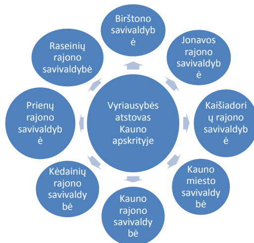
2. pav. Vyriausybės atstovo tarnyboje Kauno apskrityje prižiūrimos savivaldybės 125

Kitas savivaldoje teisėtumą kontroliuojantis subjektas, numatytas LR Vietos savivaldos įstatyme, yra Vyriausybės atstovas apskrityje. Vertinant Vyriausybės atstovo tarnybos Kauno apskrityje institutą, visų pirma, apžvalgą derėtų pradėti nuo to, jog Kauno miesto savivaldybė yra viena iš aštuonių savivaldybių, kurių teisėtumą prižiūri ši tarnyba.