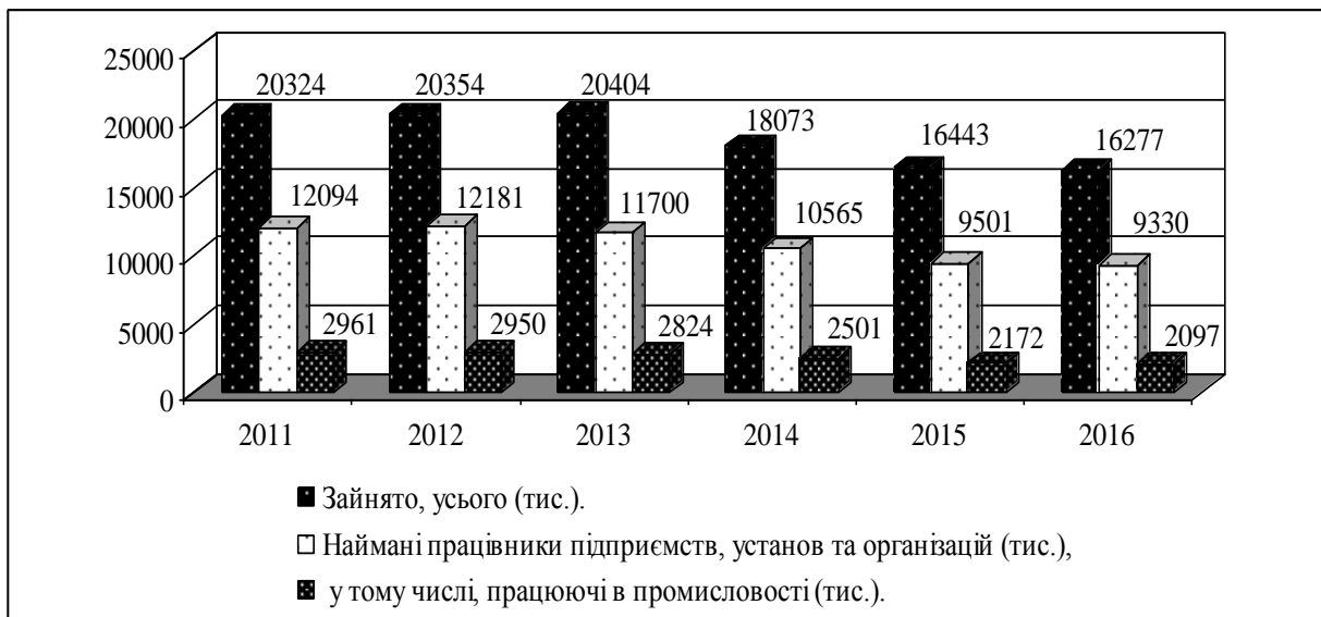
Рис. 2. Динаміка зайнятості в Україні у 2011-2016 рр.

На підтвердження вагомості загроз для України, викликаних, насамперед, відтоком працездатного населення, а також й іншими причинами, наведемо динаміку показника кількості зайнятих в економіці за останні п'ять років: якщо у 2011 р. вона становила 20,3 млн осіб (у т.ч. 12,1 млн осіб найманих працівників), то у 2016 р. відповідно – лише 16,3 та 9,3 млн осіб. Чисельність найманих працівників у промисловості країни за цей самий період скоротилася на майже на 30% [рис. 2]. Наведені дані наочно свідчать, що найбільш уразливою в умовах новітніх глобальних викликів виявилась вітчизняна промисловість, тобто деіндустріалізація країни відбувається прискореними темпами.