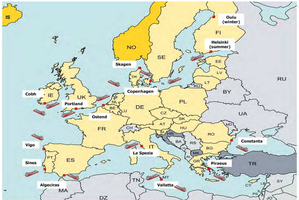
3 pav. EMSA rezerviniai naftos surinkimo laivai, rezervo ir laivų išdėstymas 179 .

Lietuvos Respublikos Vyriausybės ir Švedijos Karalystės Vyriausybės bendradarbiavimo susitarimo ekstremalių situacijų prevencijos, parengties ir jų likvidavimo srityje 6 straipsnyje nustatyti išlaidų atlyginimo teikiant pagalbą principai, kuriuose nustatyta, kad pagalbos prašanti valstybė atlygina tiesiogines išlaidas susijusias su pagalbos teikimu, pagalbos prašymo atšaukimo atveju iki atšaukimo dėl prašymo patirtas išlaidas. Pagalbą teikianti valstybė gali siūlyti neatlygintą arba dalinai atlygintą pagalbą, kaip ir bet kada atsisakyti dalies ar visų patirtų išlaidų atlyginimo. Šios nuostatos nepanaikina susitariančiųjų valstybių teisės pagal nacionalinę arba tarptautinę teisę reikalauti kompensacijos iš trečiosios šalies 180 .